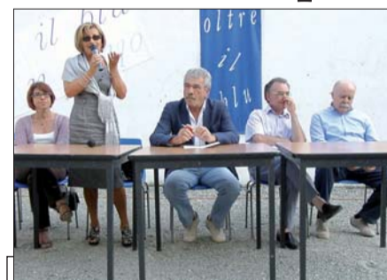
Un momento dell'inaugurazione