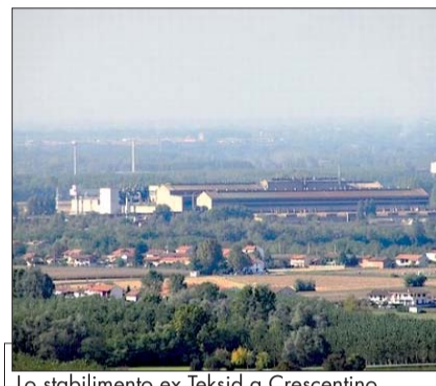
Lo stabilimento ex Teksid a Crescentino