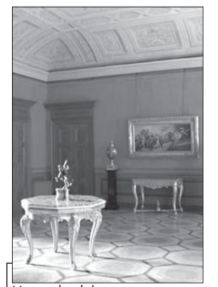
Una sala del museo

Ogni domenica, a partire dall'11 luglio, alle ore 16 verrà offerta a tutti i visitatori una visita guidata compresa nel biglietto d'ingresso: sarà un'occasione per conoscere o rivedere i capolavori, la storia,