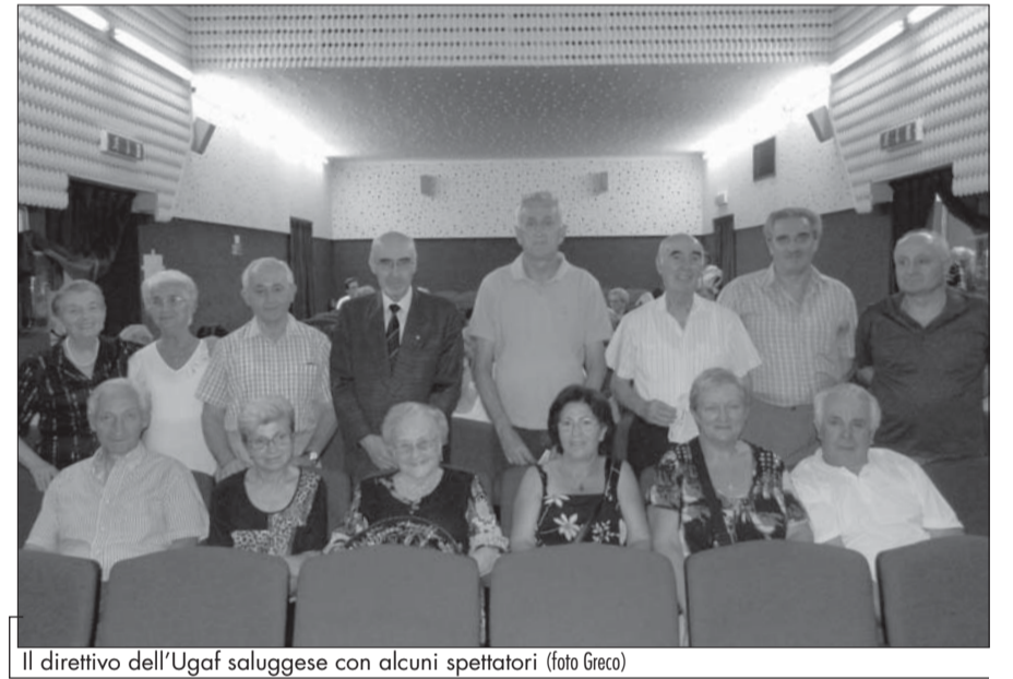
Il direttivo dell'Ugaf saluggese con alcuni spettatori