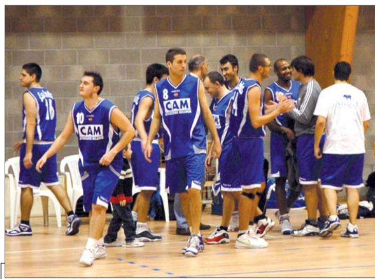
Un momento dell'ultima stagione che ha visto protagonisti i biancoazzurri