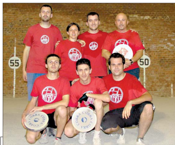
I portacolori dell'Asd Brusasco

BRUSASCO. (zv) Per la prima volta nella sua storia l'Asd Brusasco accede ai playoff del Campionato italiano di tamburello a muro di serie D. Una grande impresa quella dei rossoneri anche perché a inizio stagione ottenere il pass per la post season si avvicinava più all'utopia che al sogno. Contro il fortissimo Vignale Antica Distilleria, la compagine collinare ha compiuto davvero una grande impresa. Dopo un buon avvio, Brusasco subisce il ritorno del Vignale che trovano un buon ritmo di gara e si portano sull'11-6. Ma quando tutta sembra perduto i rossoneri hanno cambiato marcia ritrovando coraggio, intelligenza di gioco e pre-