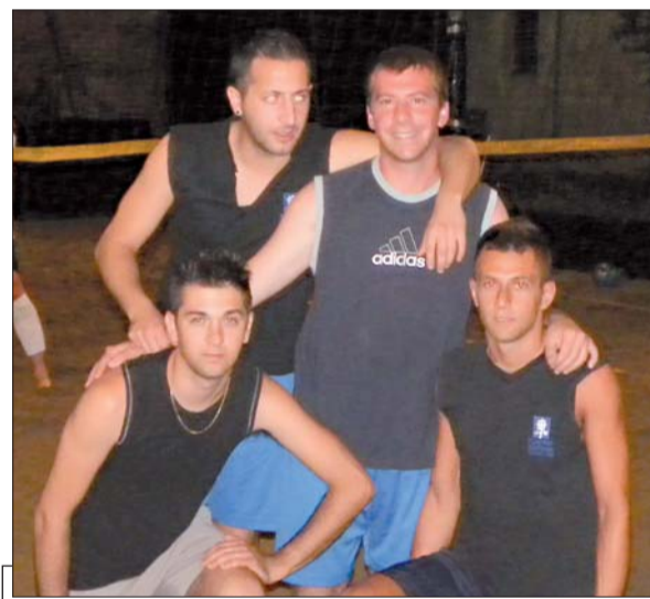
Gli Australiani protagonisti a Sant'Antonino

SALUGGIA. (hg) È iniziato il torneo di beach volley nel campo del bar L'Imperfetto a Sant'Antonino di Saluggia. La kermesse è stata organizza-