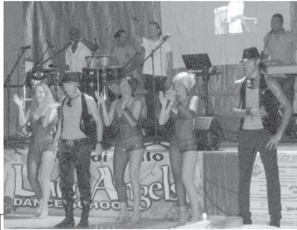
L'esibizione dei Latin Angels

FONTANETTO PO. (s.b.-i.c.) A Fontanetto il primo fine settimana di luglio si è svolta la Pesciolata, organizzata dalla Pro Loco e dal Comitato del gemellaggio. La manifestazione è iniziata venerdì sera con l'apertura dello stand gastronomico a cui è seguita la serata danzante con l'orchestra La Premiata Band. Sabato il ristorante è stato aperto anche a pranzo; la sera esibizione della band Latin Angels, che ha proposto musica latinoamericana per tutti e le esibizioni degli allievi della scuola di ballo di Crescentino.