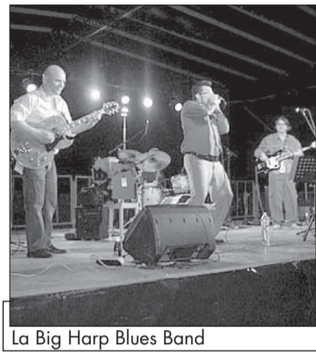
La Big Harp Blues Band

Il ritrovo è alle 9 alla Fortezza, da cui partirà una passeggiata attraverso le colline verruesi per godere l'ambiente incontaminato e le peculiarità del paesaggio; il ritorno è previsto per le 16,30 circa. Lungo il percorso saranno presenti stand