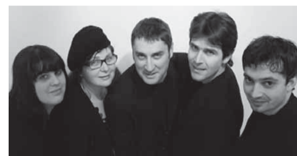
The Blossomed Voice

CAVAGNOLO. (c.car) Si è conclusa lunedì 27 luglio all'abbazia di Santa Fede di Cavagnolo, con un concerto del quintetto vocale a cappella "The Blossomed Voice", la 16a rassegna concertistica "I luoghi della musica", organizzata dall'Associazione Artex con il patrocinio e il contributo della Regione Piemonte, dei Comuni di Casalborgone e Cavagnolo e della Fondazione Renato Rosso di Castagneto Po.