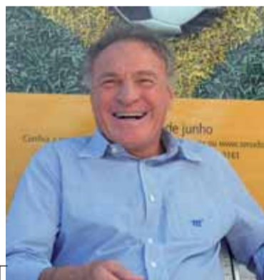
Potremmo richiamare José Altafini...

Di contorno il disinteresse della tifoseria (reale e totalmente giustificato), anche se dopo la presentazione, alle prime uscite della squadra negli stadi montani si è visto un discreto pubblico. Dal torneo birra Forst giunge l'eco del gol contro la Cremonese (!?) del campione del mondo Barone (testuale citazione dello speaker) e di prove convincenti del giovane Gorobsov (pallino di Vincent), argentino con cognome russo: speriamo che giochi come un