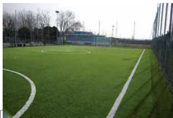
Il campo sportivo di San Sebastiano da Po

Archiviata l'esperienza, la società si è già iscritta al campionato di Seconda e sta definendo le rosa per la prossima stagione. A partire dall'allenatore,