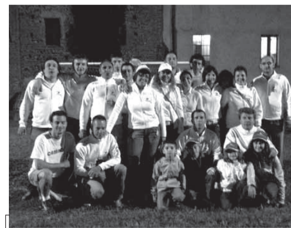
Il Campore appena vinto il Palio

rata finale dei giochi non funestata dalla pioggia, giacché moltissime era-