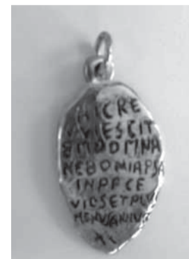
Il cippo e la sua riproduzione in forma di ciondolo

e di buon ricordo; visse in pace più o meno 90 anni".