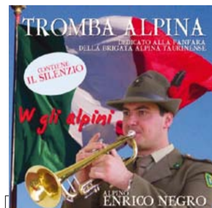
La copertina del disco

Nel 2005, 2006 e 2007 ha vinto l'audizione per la "Holstein Music Orchestra" di Amburgo, e ha preso parte a una lunga