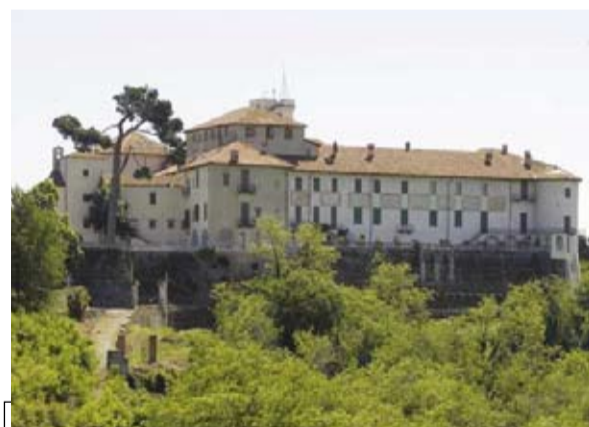
Il castello di Masino

MAGLIONE. (c.car.) Secondo appuntamento con "Territori (s)coperti", l'iniziativa del Nuovoteatrotrenta che unisce percorsi culturali, paesaggistici ed enogastronomici all'interno del nostro territorio a spettacoli di teatro e musica.