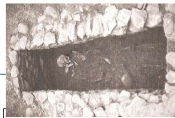
La tomba barbarica di Alice Castello