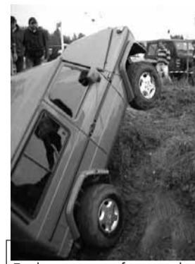
Evoluzioni con i fuoristrada

LIVORNO FERRARIS. (r.l.) Scaldano i motori gli appassionati di fuoristrada per la manifestazione amatoriale "Gran Trial di Primavera" che si svolgerà a Livorno Ferraris domenica 14 giugno.