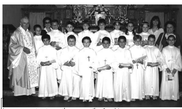
I neocomunicati con il parroco