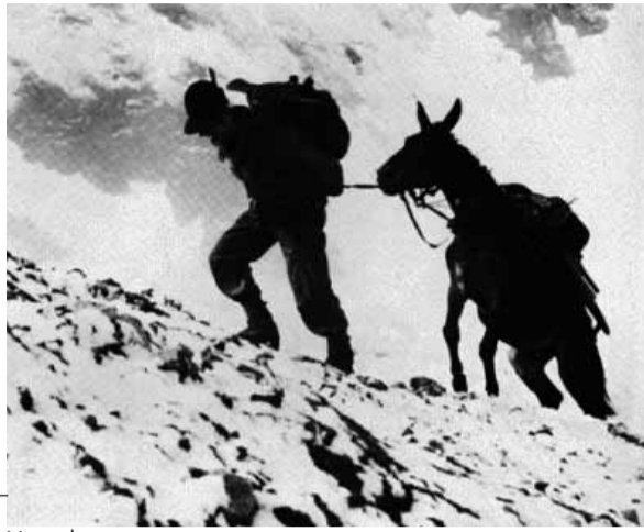
Verso la cima

Lo studio di Oliva analizza anche la formazione dell'immagine e della percezione di questo corpo militare attraverso fonti iconografiche quali manifesti d'epoca, locandine di film come Penne Nere con Mastroianni, o le illustrazioni della Domenica del Corriere . Nell'introduzione alla Storia degli Alpini ,