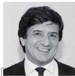
L'autore Gianni Oliva

Oliva, storico ed assessore alla cultura della Regione Piemonte, è autore di numerosi studi di storia dell'Italia contemporanea, tra cui I Savoia (1998), Foibe. Le stragi negate degli italiani della Venezia Giulia e dell'Istria (2002), Storia dei Carabinieri (2002), Si ammazza troppo poco. I crimini di guerra italiani 1940-43 (2006), L'ombra nera. Le stragi nazifasciste che non ricordiamo più (2007).