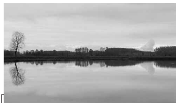
Poesia, immagine scattata in Lomellina