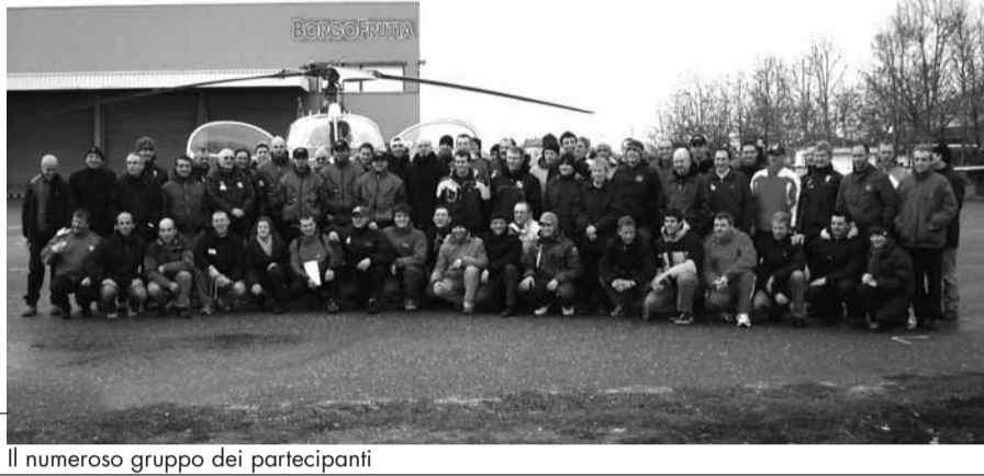
Il numeroso gruppo dei partecipanti

E' accaduto da venerdì 6 a domenica 8 febbraio, in occasione del primo convegno nazionale dei maestri di mountain bike, organizzato dalla scuola nazionale Mtb Anfitratti morenico di Ivrea, in collaborazione con l'associazione italiana AssoMaestri Mtb di ciclismo fuoristrada, con il patrocinio della Provincia di Vercelli. Sono stati tre giorni di esercitazioni lungo gli itinerari tra i boschi, laghi e colline, conferenze, proiezioni di filmati e dibattiti. Un confronto a tutto campo tra i migliori "pedali" d'Italia, che non hanno disdegnato l'ottimo cucina e le specialità tipiche locali, a partire dal molto apprezzato fritto misto. Un'occasione dunque per far conoscere Borgo d'Ale e la zona cir-